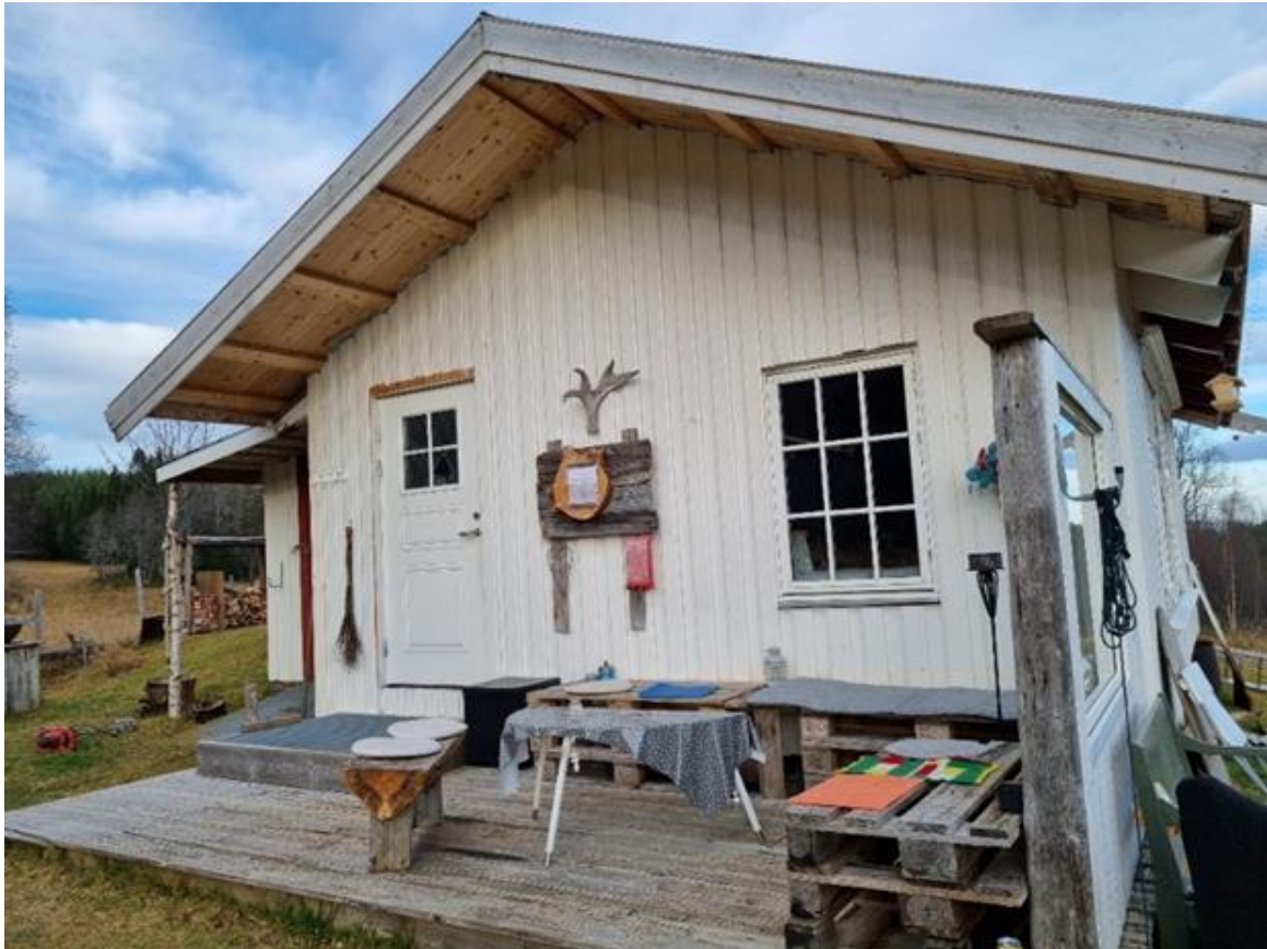
Bilde: fra befaring på Powergården.