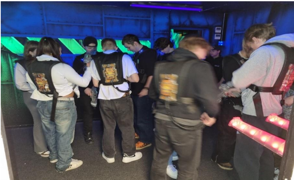
Bilde: Flere av ungdommene har dratt sammen på lazer-x som en del av søndagsaktiviteten.

Det er jo mange folk som er her. Det er jo det som er bra med Plassn, det er jo det at du får møte andre folk som du ikke kjenner, og så blir du kjent med dem. Så jeg har fått meg ganske mange gode venner her. Det er en av grunnene til at jeg var her ganske mye da. Det er jo fordi jeg kjenner de fleste som er her nå, vi har blitt ganske gode venner, vi henger også på fritiden vår og ikke bare her. Det er en av grunnene til at jeg er her.