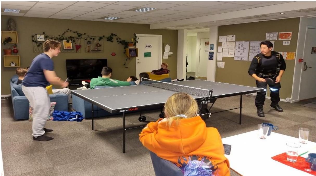
Bilde: Politiet deltar i ping-pongturnering når de er på besøk.

I oppstarten av tilbudet ble det brukt noe tid på å diskutere hvordan å forholde seg til dilemmaet knyttet opp mot ungdommer som eventuelt skulle komme innom i ruspåvirket tilstand. Prosjektleder var opptatt av at det skulle settes en standart når det kom til forebygging av uønsket kultur, og foreslo å etablere et samarbeid med politiet i form av å invitere dem på besøk når det passet for dem. Tanken bak dette var at politiets tilstedeværelse muligens kunne bidra til å bygge bro og ha positiv effekt på ungdommene dersom de fikk opparbeidet seg tillit. Politiet i Heimdal bydel jobber mye sosialfaglig rettet. Dersom ungdom skulle komme ut for noe, kan politiet hjelpe med å tilby samtaler, råd og støtte i den situasjonen de skulle være i. Politiet var flere ganger innom Plassn i prosjektperioden. Erfaringene fra de ansatte var at enkelte ungdommer fikk et annet forhold til politiet enn hva de hadde i starten. Flere av ungdommene som deltok i denne evalueringen bekreftet også dette, og en av dem sa at: «Det er jo greit at de er litt innom, vise at de bryr seg om ungdommene, at de ikke alltid er ute etter å ta folk, at de også liksom er der for oss ungdommer, bare for å se og knytte relasjoner til oss andre ungdommer».