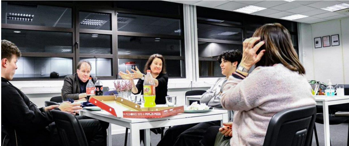
Bilde: Ungdommer og ansatte i KBT diskuterer søknad.

Etter innspill fra ungdommene startet prosessen med å skrive søknaden til Helsedirektoratet.