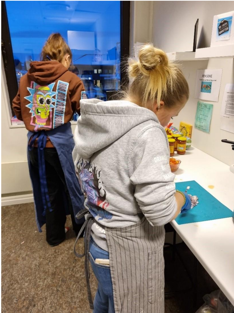
Bilde: Ungdommer lager mat på kjøkkenet.

Flere av ungdommene spilte instrumenter. Noen ganger spilte de sammen, andre ganger hver for seg. En av de ansatte hadde musikkbakgrunn og tilbød gitartimer til ungdommer som hadde lyst til å lære seg å spille gitar. Prosjektet tilknyttet seg også noen som hadde kompetanse innen musikkproduksjon. I perioder var det populært å lære seg å lage egen musikk. Kunstrommet ble også flittig brukt i perioder. Der var det muligheter for å male, tegne, fargelegge, spraymale, sy, forme og perle. Det ble også lagt til rette for at alle kunne være med å lage mat eller bake dersom de ønsket å gjøre en aktivitet på kjøkkenet.