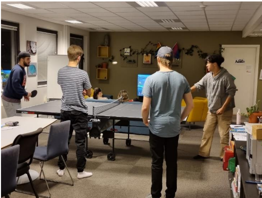
Bilde: Ping-pongturnering på en torsdag

På torsdager ble det lagt opp til konkurranser og turneringer i ping-pong, MarioKart, kortspill og andre spill. Det ble også lagd og servert vafler på torsdager.