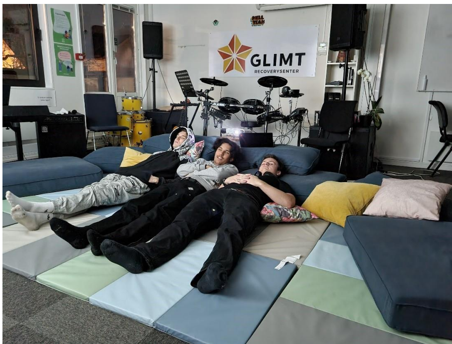
Bilde: De unge erfaringskonsulentene har trukket seg tilbake, lagt seg tilrette og slapper av på bandrommet.