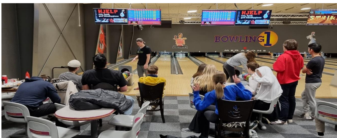
Bilde: Ungdommene er på bowling som søndagsaktivitet.

Gjennom tiden Plassn har hatt åpent har over 60 ungdommer vært innom. De aller fleste av disse har periodevis vært jevnlig besøkende i varierende grad. Etter åpning i uke 40 høsten 2022 kom det mellom 10-20 besøkende i åpningstiden. I perioden uke 40-52 var det 30 ungdommer som rullerte som jevnlig besøkende ved Plassn. Det vært mellom 20-30 ungdommer på høst og vinterhalvåret. En generell erfaring når det gjelder oppmøte er at det var mindre folk innom når det nærmet seg vår. I slutten av april, mai og i juni var det betydelig roligere. Søndagsaktivitetene var svært populære. Da kom det også ungdommer som ikke var jevnlig besøkende ved Plassn.