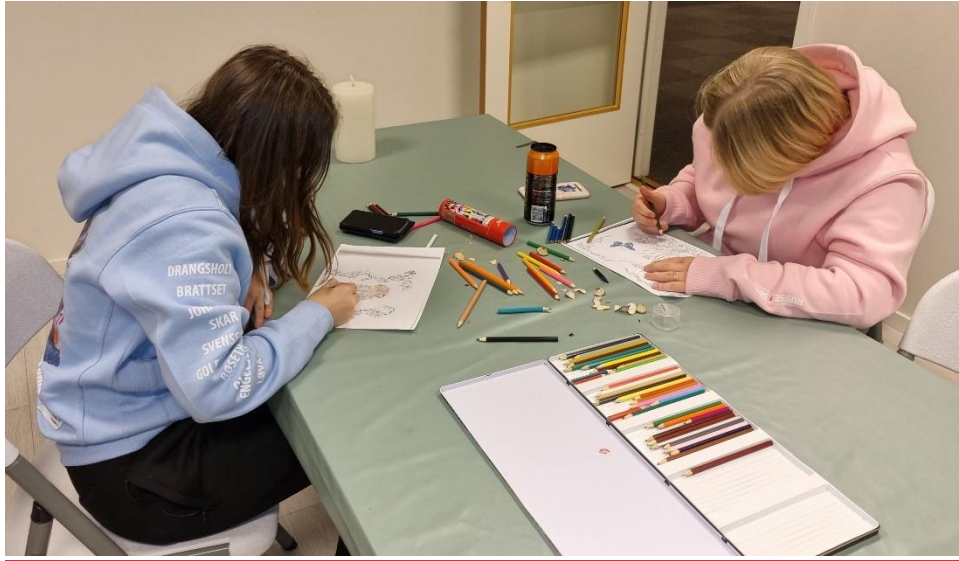
Bilde: Ungdommene opplever mestring gjennom aktiviteter på kunstrommet.

mestringsfølelse for mange. For noen gjennom aktiviteter og for andre gjennom samtaler, så det er litt sånn variert. Også har vi hatt kunst også, og der har vi hatt mange som har vært veldig flinke og som sikkert har ført til litt mestringsfølelse.