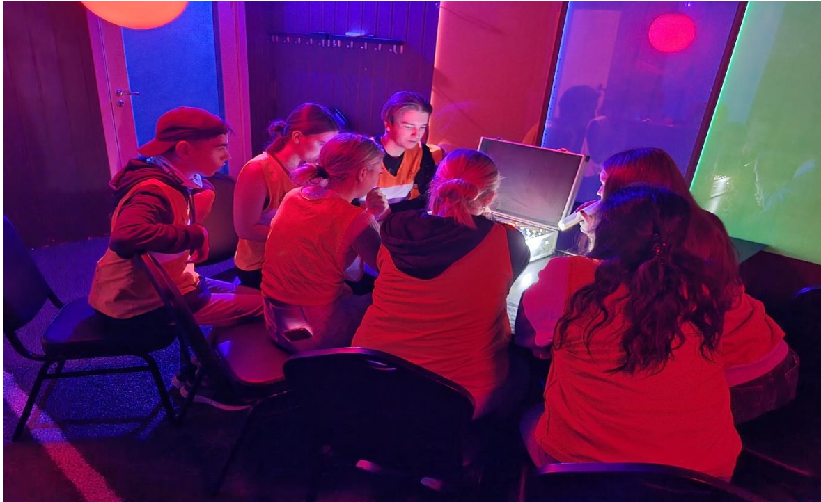
Bilde: Vi er på Escape Room. Her må ungdommene jobbe sammen for å løse oppgaver. Samarbeid og felles opplevelser styrker de sosiale båndene mellom ungdommene.

Plassn hadde åpent en søndag i måneden. Denne dagen ble brukt til å dra på aktiviteter utenfor Plassn. Søndagsaktivitetene ble, i likhet med det meste annet på Plassn, bestemt i fellesskap. Ungdommene kom med forslag til aktiviteter, og deretter fikk alle stemme på hvilken av de aktivitetene de helst ville på. Den som fikk flest stemmer ble neste søndags aktivitet. Det ble blant annet arrangert turer på kino, escape room, bowling, og lazer-X.