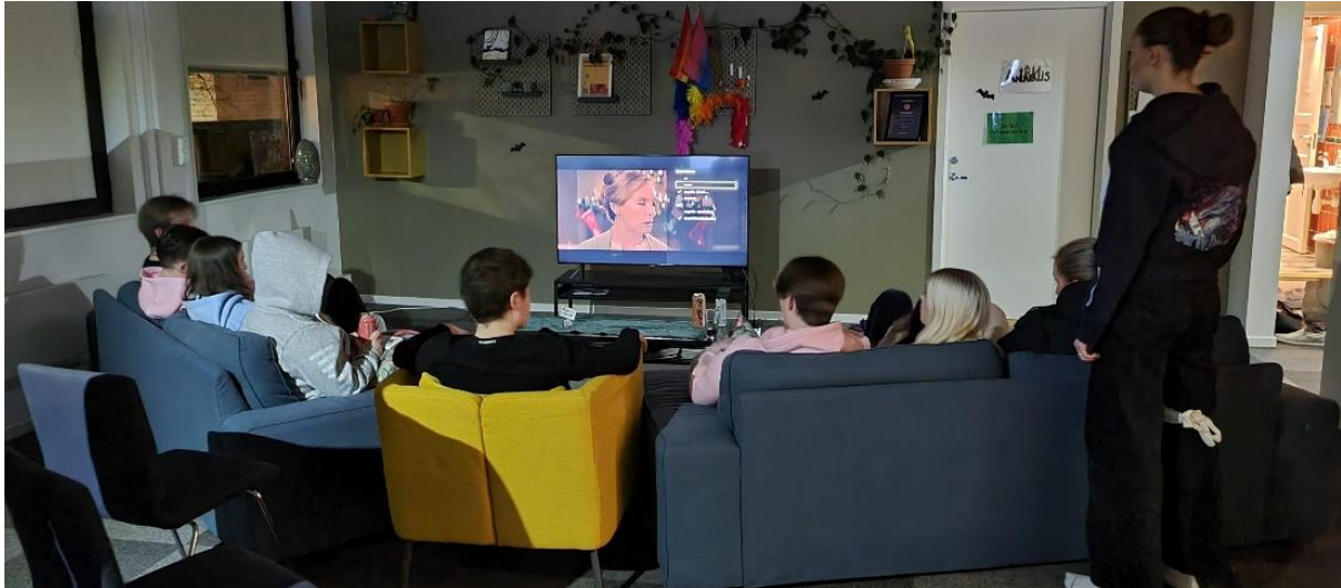
Bilde: Ungdommene ser på film i stua.

Erfaringene gjort gjennom prosjektet viser at dette har vært viktig. TV og sofakrok har vært et naturlig samlingspunkt både for samtaler og for å se på Youtubeklipp, serier, filmer, musikkvideoer, og til å spille TV-spill. Nintendo switch har vært til stor glede for flere.