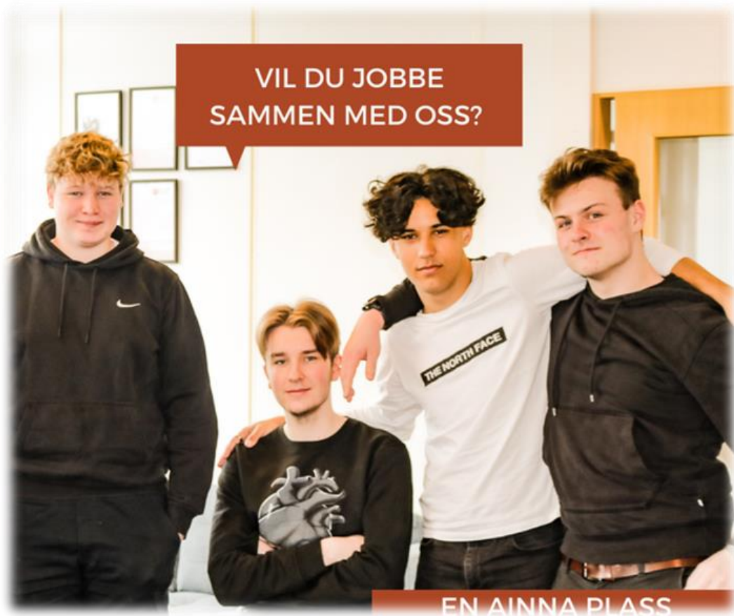
Bilde: De unge erfaringskonsulentene søker medarbeidere til prosjektet.

Ansatte ved KBT gjorde en første gjennomgang av søknadene og plukket ut de vi syntes var relevante søkere. Ungdommene var så med på å plukke ut de som skulle innkalles til intervju. Med unntak av ett intervju, var en eller flere av ungdommene med på samtlige av jobbintervjuene, og de var med på å bestemme hvem som skulle bli ansatt. Erfaringene vi i KBT gjorde oss med å ha med ungdommene i ansettelsesprosessen var utelukkende positive. Måten vi så jobbsøkerne kommuniserte med ungdommene på var i ett tilfelle avgjørende for at vedkommende fikk stillingen.