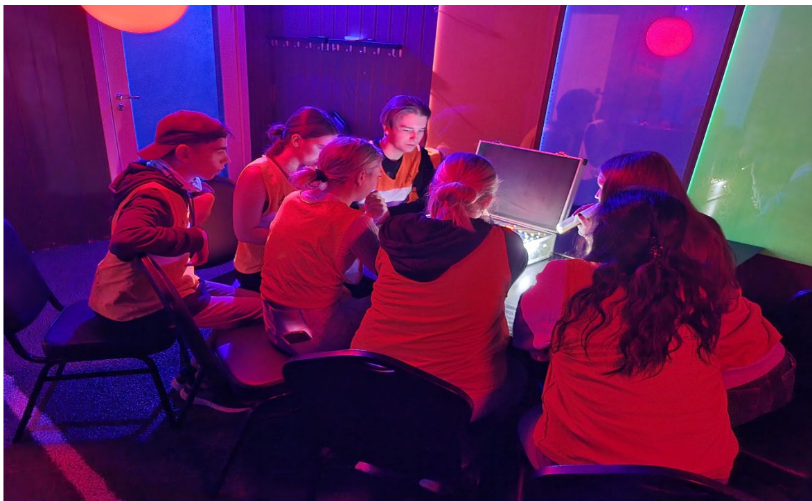
Bilde: Vi er på Escape Room. Her må ungdommene jobbe sammen for å løse oppgaver. Samarbeid og felles opplevelser styrker de sosiale båndene mellom ungdommene.

Plassn hadde åpent en søndag i måneden. Denne dagen ble brukt til å dra på aktiviteter utenfor Plassn. Søndagsaktivitetene ble, i likhet med det meste annet på Plassn, bestemt i fellesskap. Ungdommene kom med forslag til aktiviteter, og deretter fikk alle stemme på hvilken av de aktivitetene de helst ville på. Den som fikk flest stemmer ble neste søndags aktivitet. Det ble blant annet arrangert turer på kino, escape room, bowling, og lazer-X.