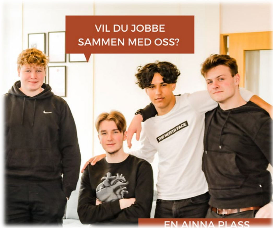
Bilde: De unge erfaringskonsulentene søker medarbeidere til prosjektet.

Ansatte ved KBT gjorde en første gjennomgang av søknadene og plukket ut de vi syntes var relevante søkere. Ungdommene var så med på å plukke ut de som skulle innkalles til intervju. Med unntak av ett intervju, var en eller flere av ungdommene med på samtlige av jobbintervjuene, og de var med på å bestemme hvem som skulle bli ansatt. Erfaringene vi i KBT gjorde oss med å ha med ungdommene i ansettelsesprosessen var utelukkende positive. Måten vi så jobbsøkerne kommuniserte med ungdommene på var i ett tilfelle avgjørende for at vedkommende fikk stillingen.