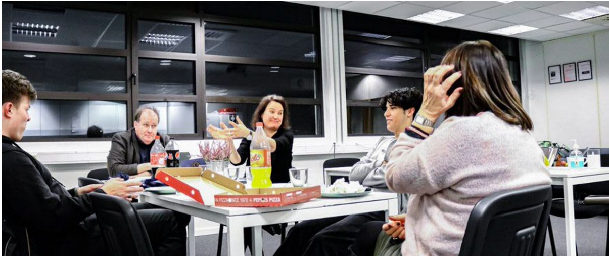
Bilde: Ungdommer og ansatte i KBT diskuterer søknad.

Etter innspill fra ungdommene startet prosessen med å skrive søknaden til Helsedirektoratet.