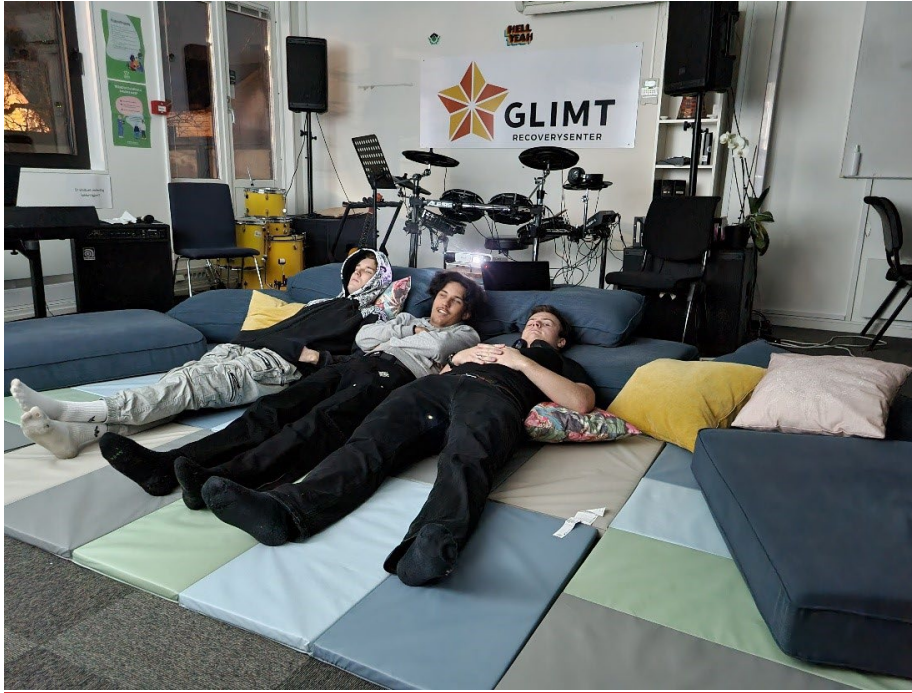
Bilde: De unge erfaringskonsulentene har trukket seg tilbake, lagt seg tilrette og slapper av på bandrommet.