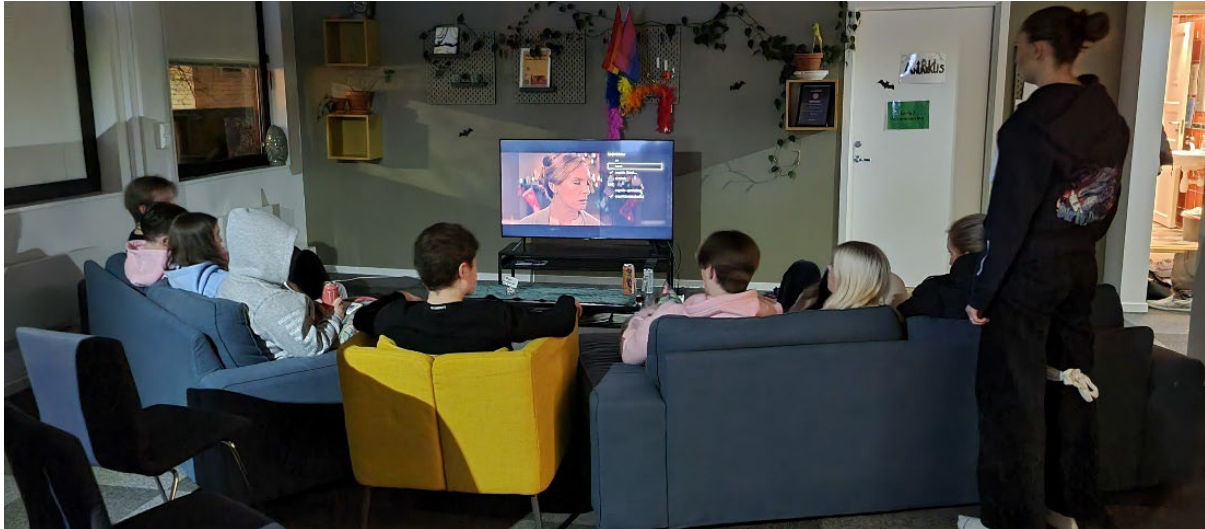
Bilde: Ungdommene ser på film i stua.

Erfaringene gjort gjennom prosjektet viser at dette har vært viktig. TV og sofakrok har vært et naturlig samlingspunkt både for samtaler og for å se på Youtubeklipp, serier, filmer, musikkvideoer, og til å spille TV-spill. Nintendo switch har vært til stor glede for flere.